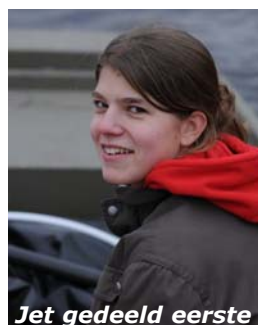
Jet gedeeld eerste

M: 06 - 127 62 480 E: m.bakker@brainstobuild.com