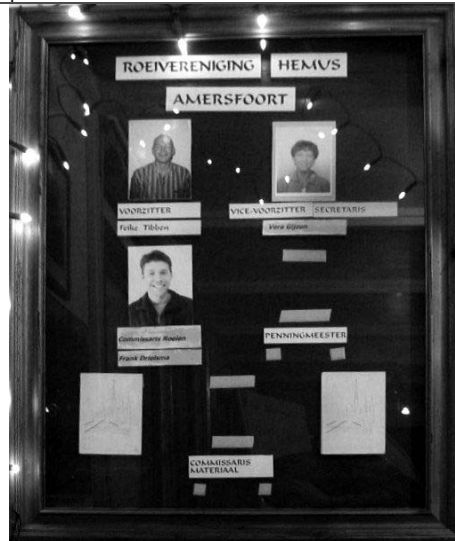
De bestuurskast in de Villa maakt al enige tijd een desolate indruk.