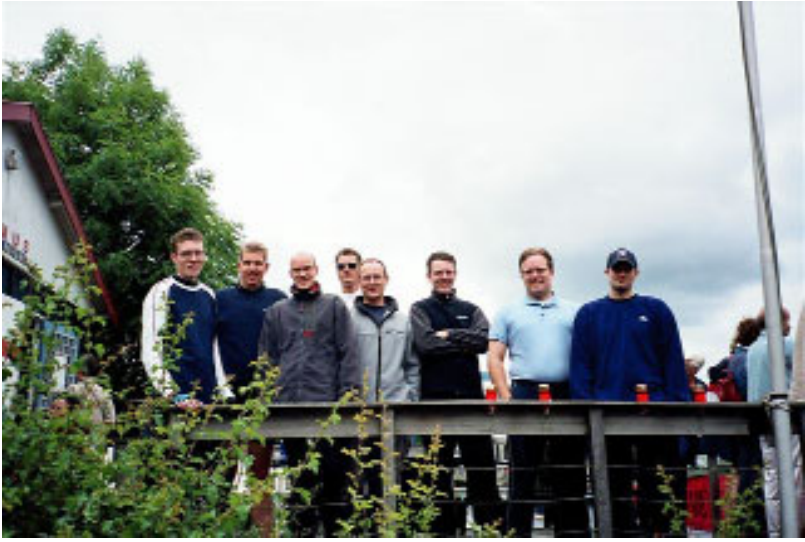
allemaal blijde mannen

Het loopt storm bij het afroeien. In mei en juni zijn in totaal 34 mensen afgeroeid.