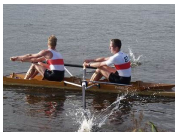
Waterballet door twee bestuursleden