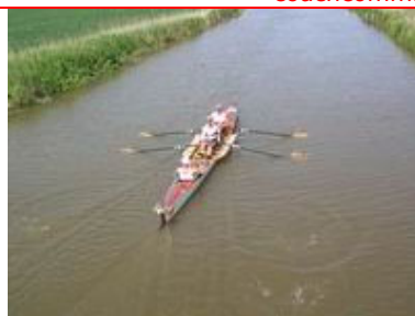
3 mannen, elf steden