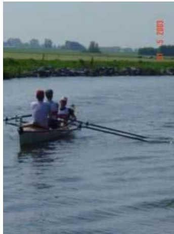
Onderweg tussen Workum en Bolsward

dan stoppen ze. Dan blijkt dat een blessure waarmee je op zich nog wel kunt roeien een groot probleem kan zijn op zo'n lange afstand.