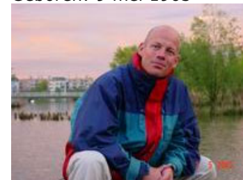
en nu al zo groot!

Ik ben ik 1995 lid geworden bij Hemus. Daarvoor heb ik jaren aan atletiek gedaan en ben ik amateur wielrenner geweest. Ik heb bij Hemus leren roeien. Het eerste jaar heb ik vooral geleerd, daarna ben ik steeds meer gaan doen. Eerst de freshman's race, toen nog apart, nu opgenomen in het afroeschema van de nieuwelingen. Daarna heb ik aan de wieg gestaan van de Eemhead. Deze wedstrijd was eerst alleen nog een onderlinge wedstrijd tussen de verenigingen uit Baarn en Amersfoort, maar is in 1997 voor het eerst open gehouden en direct een groot feest. Nu is de wedstrijd, inmiddels DHV-Eemhead geheten, niet meer weg te denken van de nationale kalender. In 1999 ben ik voorzitter geworden van Hemus. Eén van mijn eerste officiële daden was de opening van het nieuwe clubhuis, Villa Hemus. Toen waren we er heel blij mee, wie kon denken dat we koud drie jaar later al weer uit onze jas groeiden?