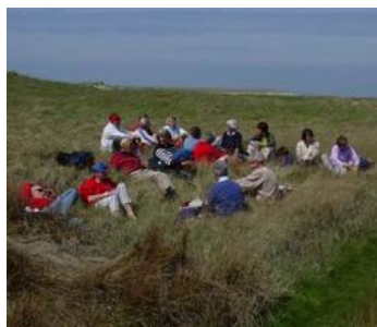
Midweekluieren op Texel

Eem en vijf van Hemus. Daarna per bus naar Den Burg waar fietsen klaar stonden. Hierop volgde een fietstocht van zo'n 40 km over smalle fietspaden in de duinen en door de polders. Bij de Slufter werd gerust, wat gegeten en gedronken en hierbij werd van allerlei lekkers, door de dames zelf gemaakt, aangeboden.