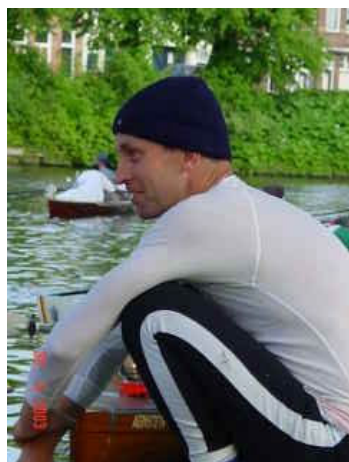
Marien bij de Elfstedentocht

Andere Hemusploegen waren minder spectaculair aanwezig. De meisjes-18 dubbeltwee werd laatste in hun veld van drie; Heren veteranen 4 vloog uit de bocht en werd 6e van de 7. En de heren veteranen acht tenslotte kwam ondanks een spectaculaire dubbele inhaalmanoeuvre niet verder dan een 16e plaats in een veld van 22 boten.