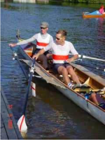
Aankomst bij Wetterwille: bevrijdende lach op de gezichten