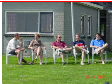
Elfstedentocht: 5 van de 39