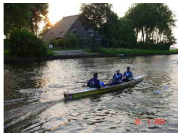
Schemer, foto Leonie Walta

Vlak voor Balk fotografeer ik onze helden met de half verduisterde zon op de achtergrond. Uniek beeld. Aan het einde van de Luts liggen Hemus en de Amstel broederlijk naast elkaar. Mooi plaatje. Het lijkt op een dauwtraptocht.