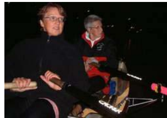
Midzomernachttocht: de grootste hit van de Toercommissie

veel moeilijker gaat? Volgens Hilhorst ligt dat aan de opgebouwde traditie binnen de vereniging. Of liever: aan het gebrek hieraan. RV De Eem uit Baarn is 70 jaar ouder dan Hemus. Hemus moet zijn tradities nog gaan vestigen. Een ervan is er al: de midzomertocht, die staat als een huis.