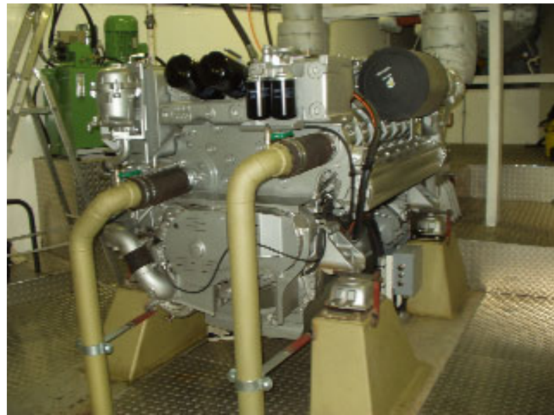
Meer power dan Henk in zijn skiff...

De toppen van de golven lopen langs de bovenkant van de beschoeiing en die steekt daar ongeveer 70 tot 80 cm boven het wateroppervlak uit zodat de afstand tussen golftop en golfdal tegen de anderhalve meter moet lopen. De eerste golf slaat volledig over de boeg, kletst tegen mijn rug, laat het kuipje helemaal vollopen en tilt vervolgens de skiff zo hoog op dat het achterstevan naar beneden het water in duikt en het lijkt of ik met boot en al de roltrap afa. Het achterstevan wordt weer omhoog gegoid en mijn hoofd zwipt mee: ik kijk verbijsterd tegen het achterstevan van het vrachtschip: "Calibra!"