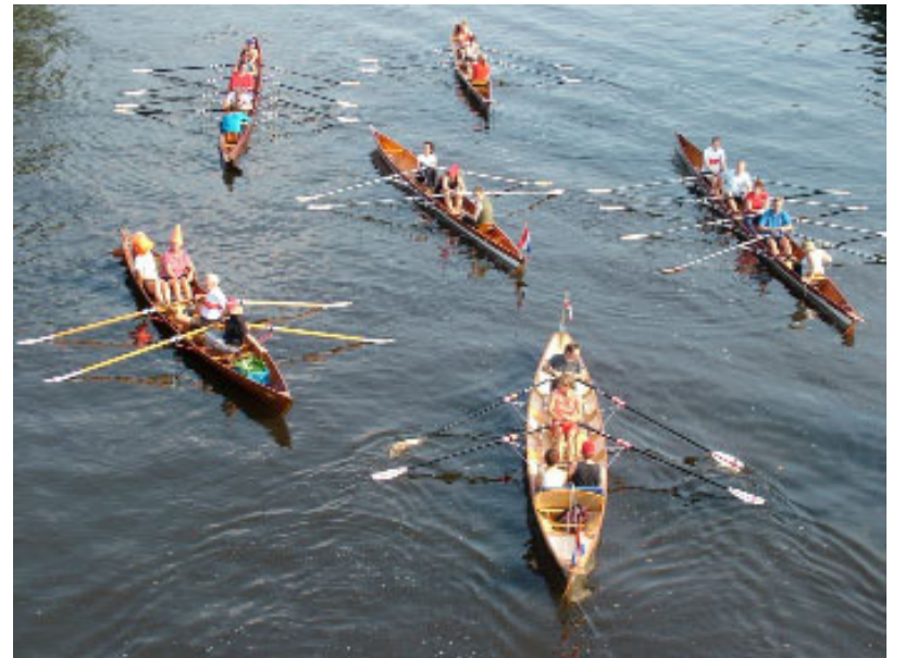
De zes boten bij de Driesluizenbrug

Wat is er dan leuker om dat eerste jaar 'officieel' af te sluiten met een rondje roeien en een neut. En zo geschiedde. Zaterdag 4 september werden alle eerstejaars door Piet, Yvonne, Els, Arno (afwezig) en Koos uitgenodigd om zich te melden bij de villa. De opkomst was zeker niet maximaal maar toch was de groep groot genoeg om zo'n zes boten te bevolken. Na een korte instructie over de bedoelingen vertrok iedereen richting driesluizen brug waar Koos zich inmiddels geïnstalleerd had met de camera om een aantal foto's van de groep te maken (zie www.hemus.nl ).