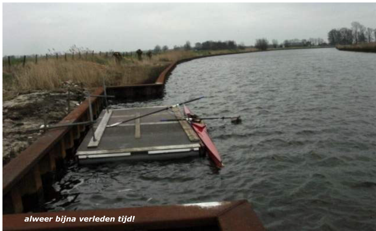
alweer bijna verleden tijd!