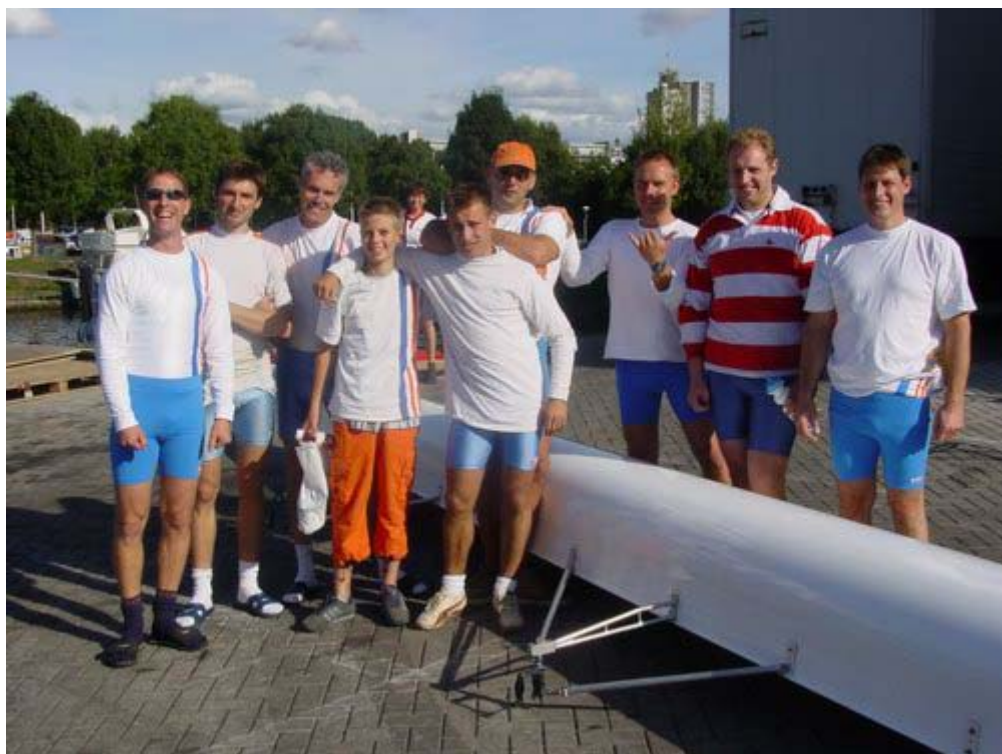
De winnende ploeg van Tromp

Afgelopen zaterdag werd onder ideale omstandigheden (weinig wind, niet te warm en geen stroming) de negende editie van de DHV Eemhead vervaren. Hemus ontving op de Eem meer dan 130 ploegen uit het hele land en de baanrecords sneuvelden bij bosjes.