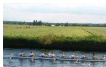
Tromp deed het beter

Met een lichte kater, maar opgewekt doordat tegen alle verwachtingen in de zon scheen, meldde hij zich zaterdag op het vlot. Zijn humeur werd er nog beter op toen hij vernam dat hij in het middenschip moest zitten. Mooi, kon hij zich lekker verstoppen en een beetje soften. Niet vergeten om op de juiste momenten een moeilijke bek te trekken voor op de foto. Leuk om straks aan de familie te showen. Alleen even oppassen voor het gelijke in- en uitpikken, anders staat het weer zo lullig.